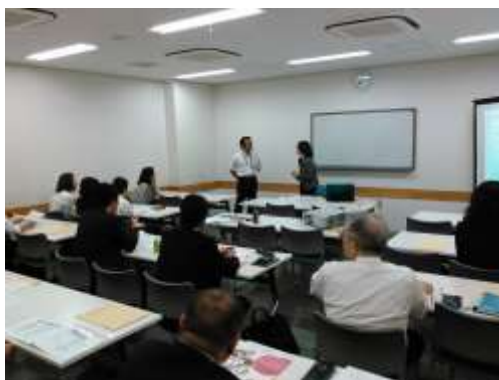
【6 月分科会講演の様子】

その後場所を移して行った懇親会では、ストレスチェックの大変さなどを、より深く教えていただきおおいに盛り上がった。